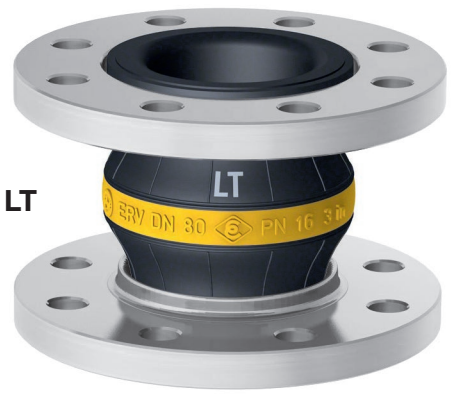
Type ERV-G LT

Manchon compensateur ERV-G LT (anneau jaune) exécution spéciale basse température pour produits pétroliers, diesel, fioul jusqu'à +90°C, JET A1, kérosène, pétrole jusqu'à +60°C et carburants jusqu'à +40°C. Température (en fonction du fluide) -40°C jusqu'à +90°C, pointes jusqu'à +100°C. Conducteur.